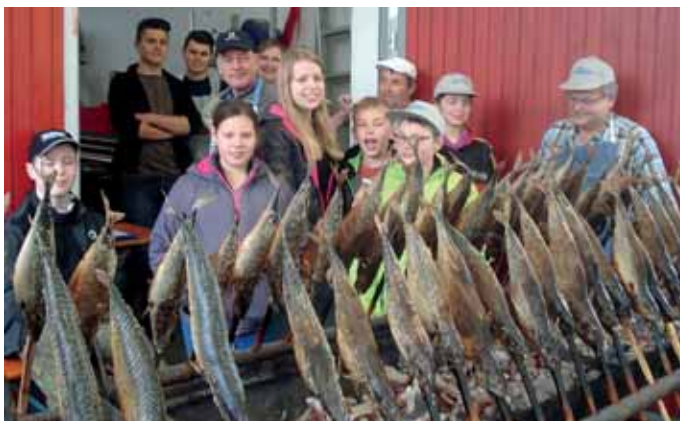
"kleiner Teil" vom Karfreitags-Team