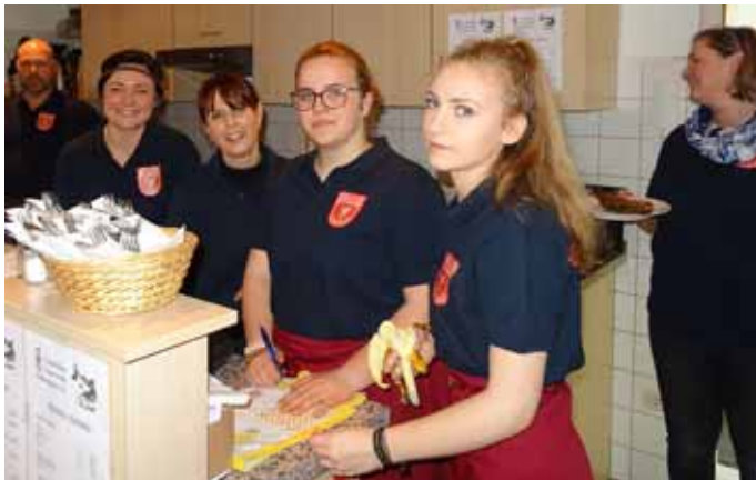
Teil des Bewirtungsteams beim Steckerlfisch grillen

Pünktlich um 10:00 Uhr begann auch heuer wieder der Verkauf von Steckerlfischen und gebratenen Forellen am Feuerwehrhaus in Schachach. Dank der Vorbestellungen, speziell bei den Forellen, sowie den Einsatz von großen Grills kam es auch dieses Jahr kaum zu Wartezeiten. Da parallel zum Mitnehmen ebenso der Verzehr vor Ort möglich war, hatte auch das Bewirtungsteam alle Hände voll zu tun, zumal es am Nachmittag noch Kaffee und Kuchen gab. Da der reibungslose Ablauf an so einem Tag nur mit einem eingespielten Team, welches mit Freude bei der Arbeit ist, möglich ist, möchte sich die Vorstandschaft bei allen Helferinnen und Helfern, die seit vielen Jahren am Karfreitag dabei sind und den Jugendlichen, die inzwischen ein verlässlicher Teil dieses Teams sind, für ihr Engagement bedanken.