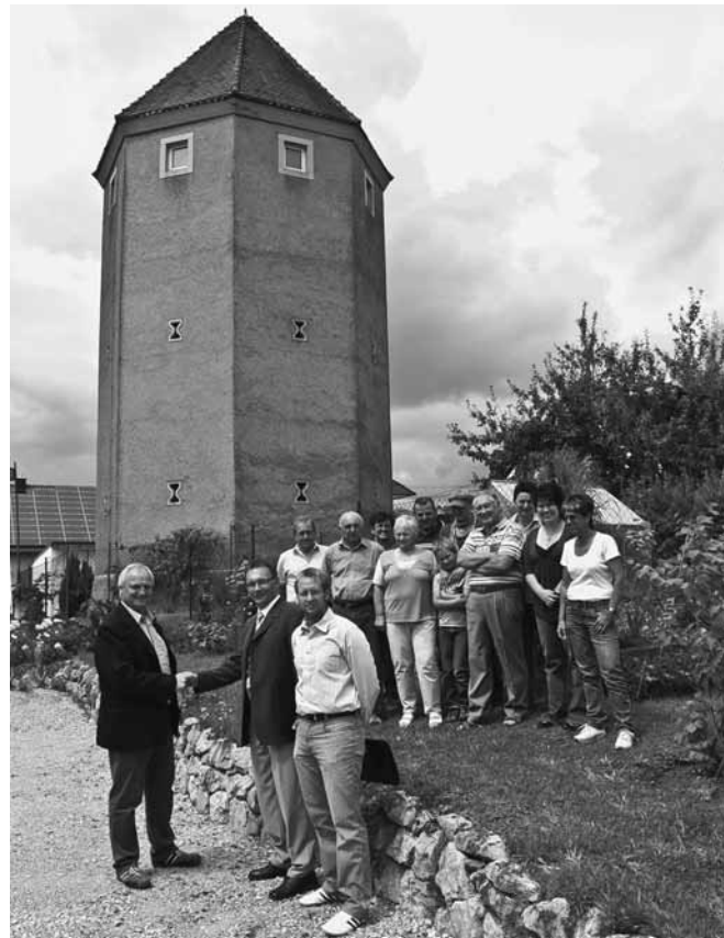
Anwesende Alberzeller Bürger beim Abschluss des Kooperationsvertrages mit der Telekom AG

Dieser zukunftsweisende Ausbau garantiert Übertragungsraten von mindestens 6.000 bis 16.000 Kilo/Bits in der Sekunde. Damit beginnt ein neues Internetzeitalter für den Ortsteil Alberzell.