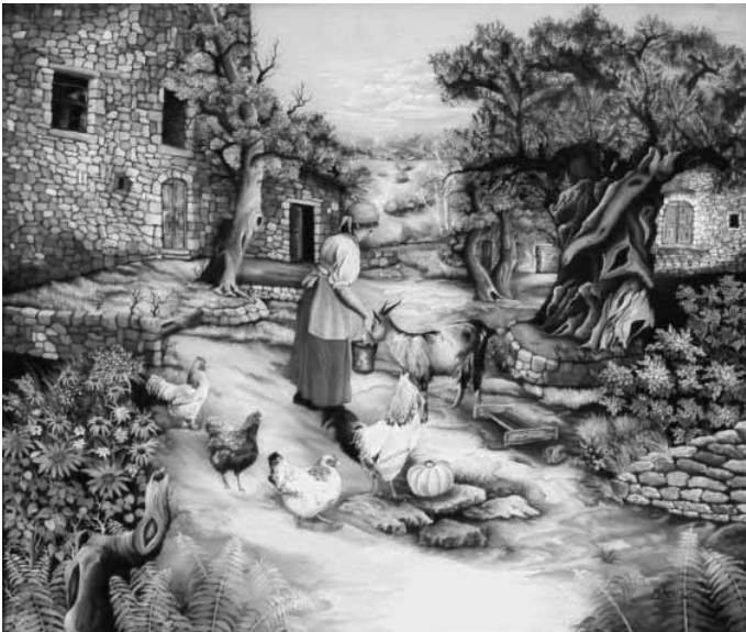
Auf dem Bauernhof

Die Menschen erscheinen wie Märchenfiguren. Fröhlich und sorglos erledigen sie unbekümmert die täglichen Arbeiten. Sie legen gerne Pausen ein und verweilen schmunzelnd mit ihren Mitmenschen in deren vertrauter Welt. Alles wirkt harmonisch und verständlich.