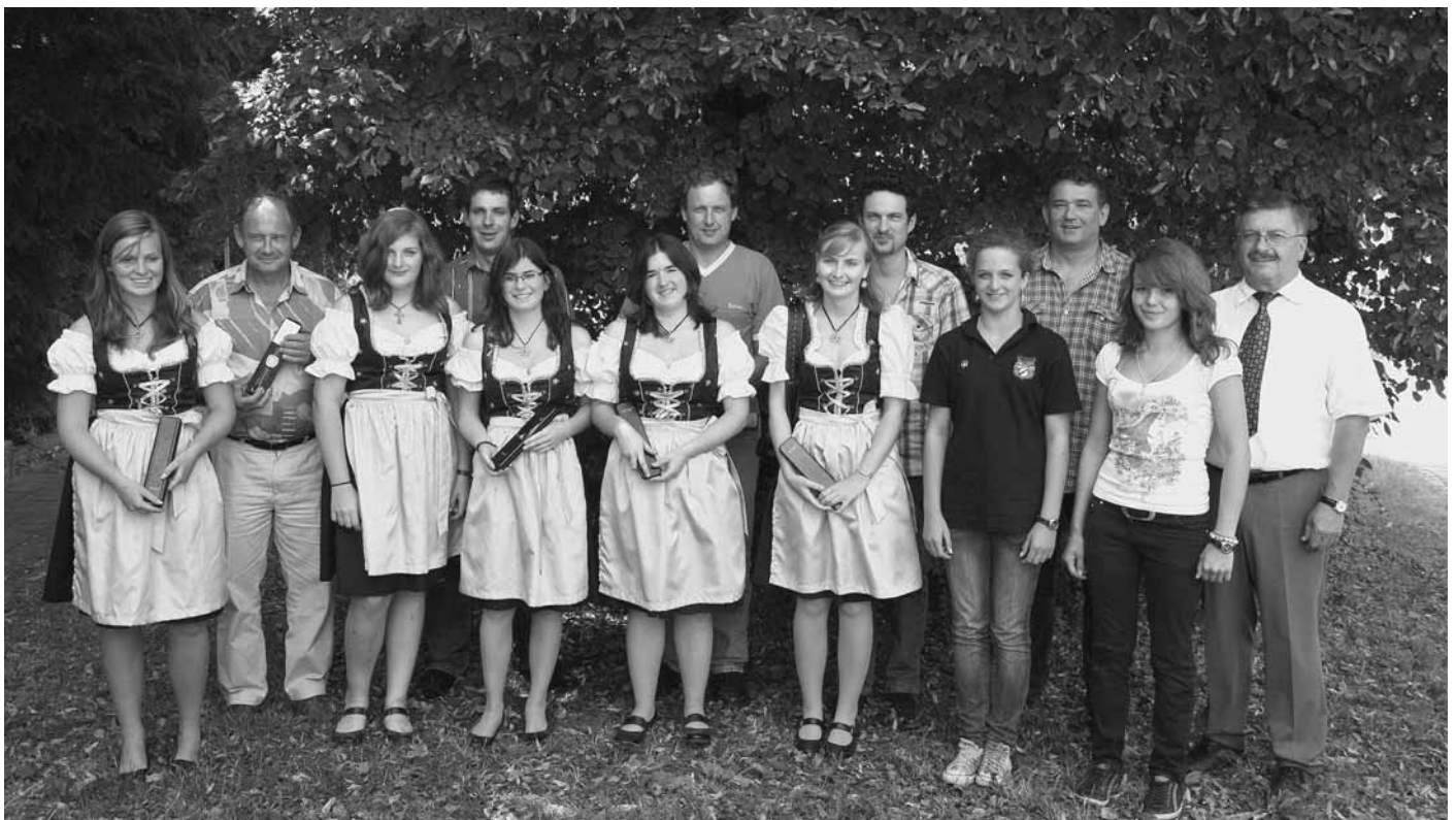
Sie erhielten die zum Fest angeschaffte Vereinsuhr, Festmädchen und Mitglieder mit besonderen Leistungen beim 100-jährigen Gründungsfest.