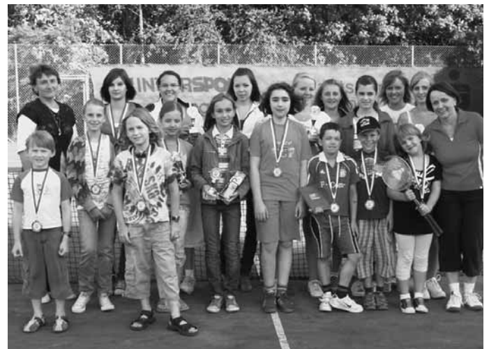
Strahlende Gesichter bei den Meisterschafts-Teilnehmern