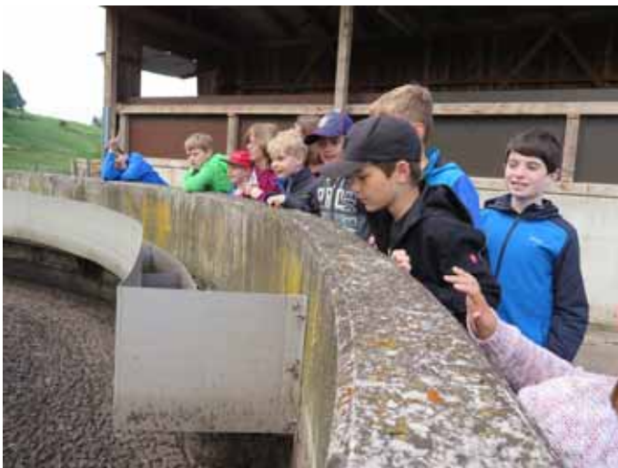
Der Klärschlamm wird in zwei großen Becken gesammelt.