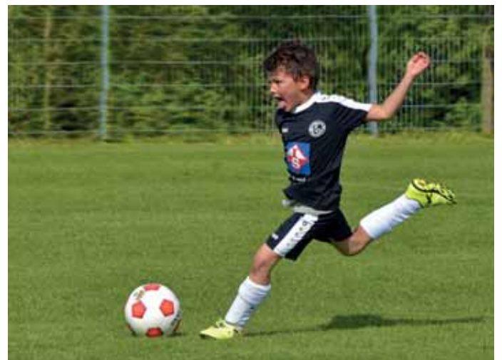
FCG-Schnappschuss – so dynamisch kann Fußball sein!

Der FC Gerolsbach bedankt sich bei all seinen Freunden, Fans, Mitgliedern, Helfern, Gönnern und Sponsoren für die tolle Unterstützung in vielerlei Hinsicht – vom jüngsten Nachwuchsspieler über die Mädchen-, Damen- und Senioren-Mannschaften bis hin zu den Alten Herren! Alle Zuschauer & Fans sind jederzeit stets herzlich willkommen!