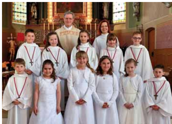
Gerolsbacher Erstkommunion vom 22. April 2018