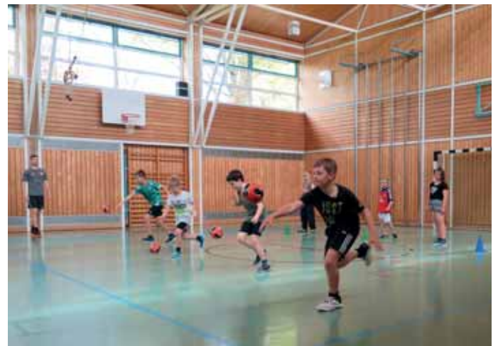
Handball macht Spaß!