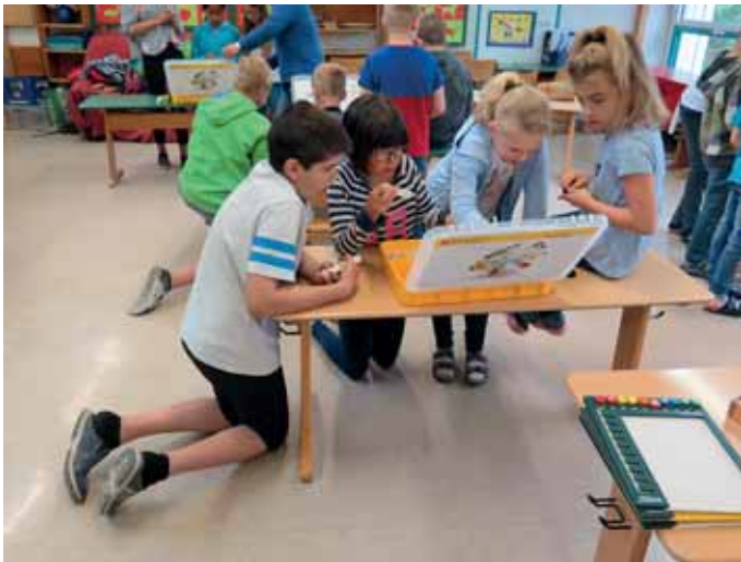
Aus vielen Teilen entsteht ein Fahrzeug.