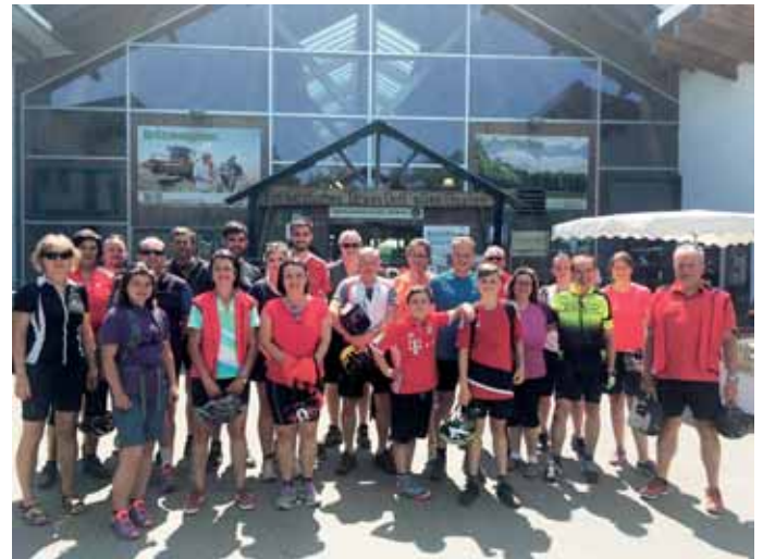
Gruppenbild Teilnehmer Radtour der Frisch-Auf Schützen Singenbach 2018

„Übers Land zum Bauernmarkt nach Dasing“