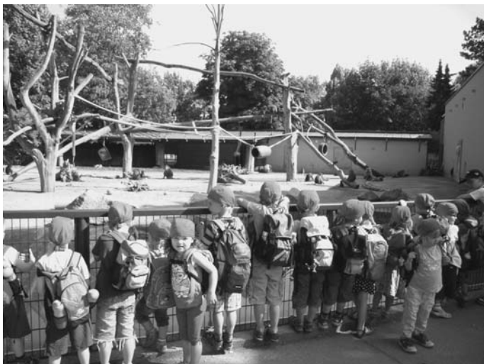
Immer wieder faszinierend: die „Affen mit dem gaaanz roten Popo“.

Unser Ausflug führte uns dieses Jahr in den Augsburger Zoo. Unterstützt begleitet uns einige Eltern, so dass wir in kleinen Gruppen das Leben im Tierpark bestaunen konnten. Begeistert beobachteten die Kinder Tiere wie z.B. den Wolf, der ganz nah an uns vorbei lief, sowie Giraffen und Zebras, die durch ein Fernrohr aus der Nähe betrachtet werden konnten. Zum Abschluss erwartete uns der lang ersehnte Spielplatz, und für alle Kinder gab es noch ein Eis. Nach einem schönen, aber auch anstrengenden Tag fielen dann doch vereinzelt Kindern bereits auf der Heimfahrt die Augen zu.