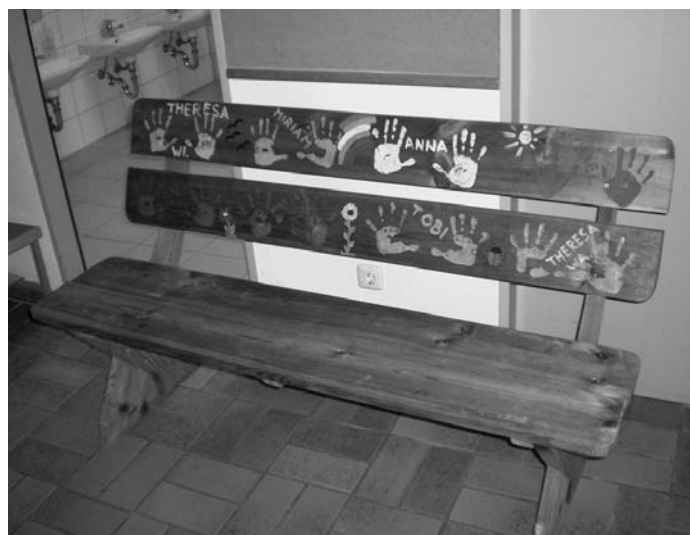
Wir – die „Kleinen“ und das Personal – wünschen allen Schulanfängern und ihren Familien einen guten Start in die Schule!