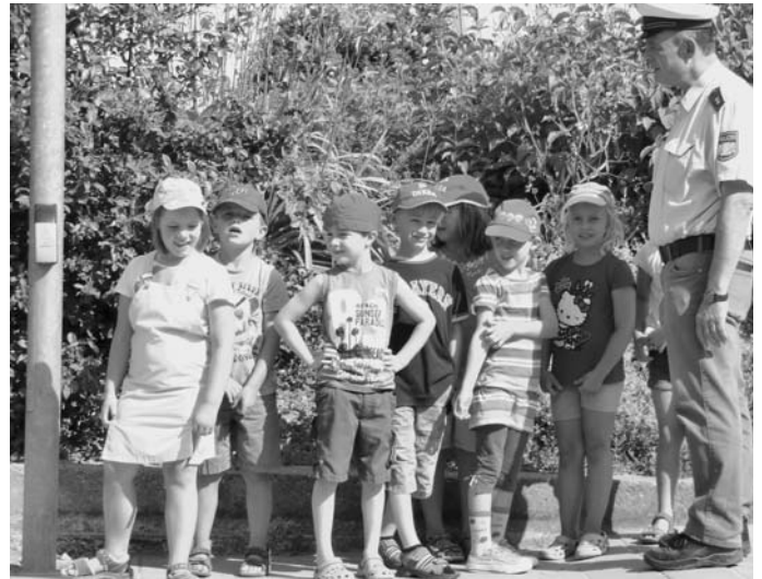
Mit viel Spaß wurden die Kinder in den Straßenverkehr eingeführt.