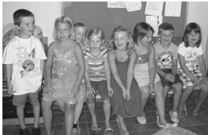
Auf der neuen Bank sitzend trugen die Vorschulkinder den Erzieherinnen ihr Abschiedslied vor

Nun war's so weit – der Abschiedstag war da. Mit besonderen Leckereien und Geschenken wurden unsere Großen in ihren Gruppen verabschiedet. Zwischendrin gaben die Vorschulkinder ihr Abschiedslied noch einmal vor dem kompletten Personal und den kleineren Kindern zum Besten – natürlich gemütlich auf der neuen Bank sitzend, dem Abschiedsgeschenk an den Kindergarten. Jetzt beginnt bald der „Ernst des Lebens“. Die Vorfreude ist groß, doch der Abschied wehmütig.