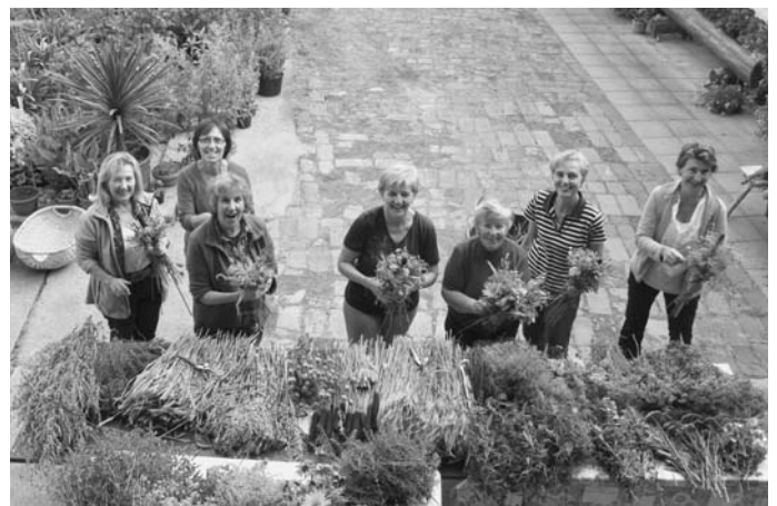
Viele Hände, schnelles Ende“. Mit Begeisterung und Spaß wurden die Kräuterbüschel gebunden

Den ganzen Hof zierte zudem eine Blumenpracht, vergleichbar mit der Landesgartenschau. Meterhohe und –breite Hortensien in verschiedenen Farben, Fuchsienstöcke mit hunderten von Blüten oder Palmen und