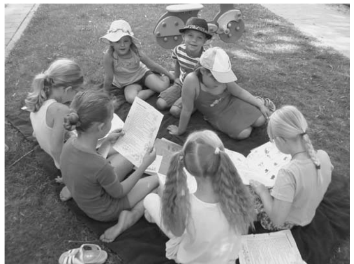
Ganz Ohr waren die großen Kindergartenkinder, als sie von ihren „Vorgängern“ die Geschichten vorgelesen bekamen.