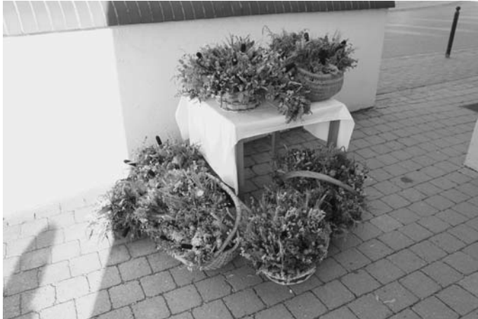
Die fertigen Kräuterbüschel wurden vor der Kirche gegen ein geringes Entgelt angeboten.

Die verschiedensten Kräuter wie Johanniskraut, Schafgarbe, Baldrian, Arnika, Königskerze, Kamille, Wermut, Pfefferminz, Tausendgüldenkrout, Thymian, Rohrkolben, sämtliche Getreidesorten und natürlich auch Blumen aus dem Hausgarten wurden auf großen Tischen aufgerichtet und dann Stück für Stück zu einem Kräuterbüschel zusammengefügt. Stolz betrachteten die Kräuterweiberl nach getaner Arbeit die fertigen Sträuße, so ca. 60 Stück und saßen anschließend noch gemütlich beisammen.