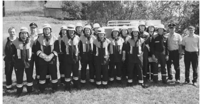
Die erfolgreiche Singenbacher Feuerwehr nach der Leistungsprüfung