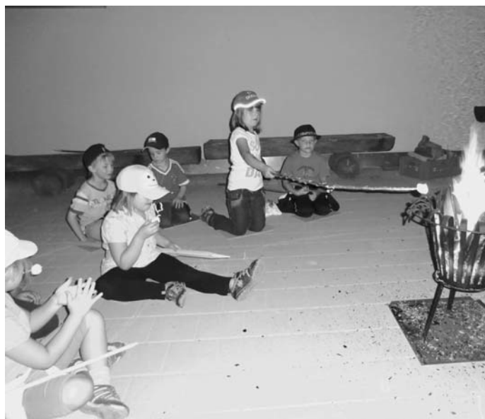
Hmm, Marshmallows am Lagerfeuer – lecker!

... durften die acht Vorschulkinder des Kindergartens Regenbogen verbringen. Nach Einrichtung unseres gemütlichen Schlafplatzes und Laufspielen im Garten gab's erst mal eine Stärkung: Pizza und Tiramisu. Danach packten die Kinder ihre Taschenlampen und auf ging's zur Nachtwanderung. Trotz zweier Pausen an den Gerolsbacher Spielplätzen waren doch alle schon etwas müde, als wir wieder im Kindergarten ankamen. Dort erwartete uns bereits ein Lagerfeuer. Die Klassiker unsrer Übernachtungslieder stimmten uns ein, dann gab's noch ein Betthupferl: am Spieß gegrillte Marshmallows, hmmm. Und schon ging's ins Bett.