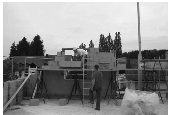
Freiwillige Helfer bei Arbeiten am Dachgeschoss

In diesem Zusammenhang kann man nur sagen, es ist unglaublich welche Anzahl von freiwilligen Helfern zum Gelingen unseres neuen gemeindlichen Herzstückes beitragen! Herzlichen Dank dafür und macht weiter so.