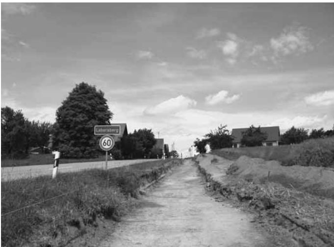
Radweg: Gerolsbach – Strobenried; Abschnitt vor Labersberg

Der Radwegbau von Gerolsbach nach Strobenried ist bereits angelaufen und schreiten zügig voran. Vor allem den Grundstückseigentümer/innen, die bereit waren einen Teil ihrer Fläche für die Allgemeinheit abzutreten, gilt unser größter Dank. Ohne ihre Bereitschaft könnten wir die Verbindung unserer Ortsteile nicht realisieren.