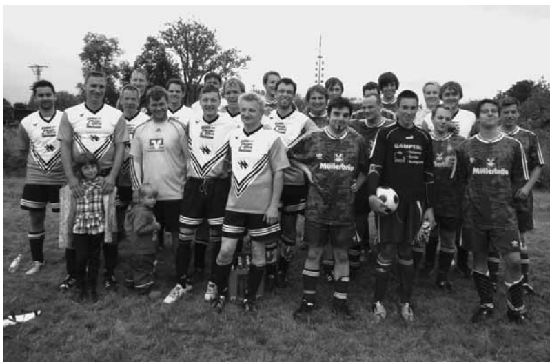
Im Bild die Akteure der heiß umkämpften Begegnung.

Nachdem 2010 die Vatertagsbegegnung der ledigen gegen die verheirateten Singenbacher witterungsbedingt ausfallen musste, konnte dieses Jahr bei guten äußeren Bedingungen wieder zum Anstoß gepfiffen werden.