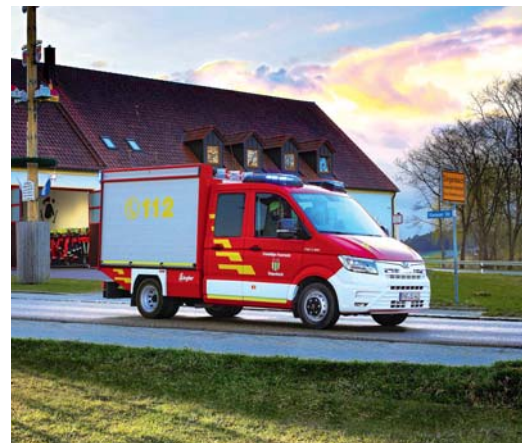
Das neue Singenbacher Feuerwehrfahrzeug, dieses Foto wird eventuell in den Jahreskalender 2020 der Firma Ziegler als Monatsmotiv abgedruckt.